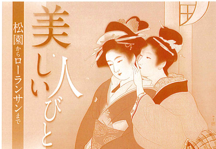
上村 松園 《春宵》部分